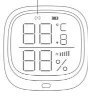
环境传感器正面示意图

环境传感器采用ZigBee 3.0通信协议, 支持无线传输数据的家居环境监测传感设备。通过智慧家庭主机, 用户在使用时可以实现远程查看实传感器所在区域的温度、湿度、光照度, 实现触发联动等功能。